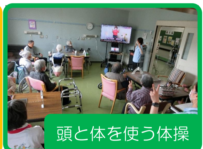
頭と体を使う体操